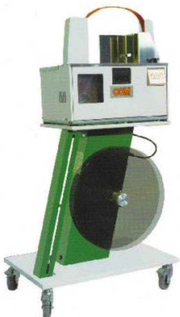
Untergestell für Großrollen